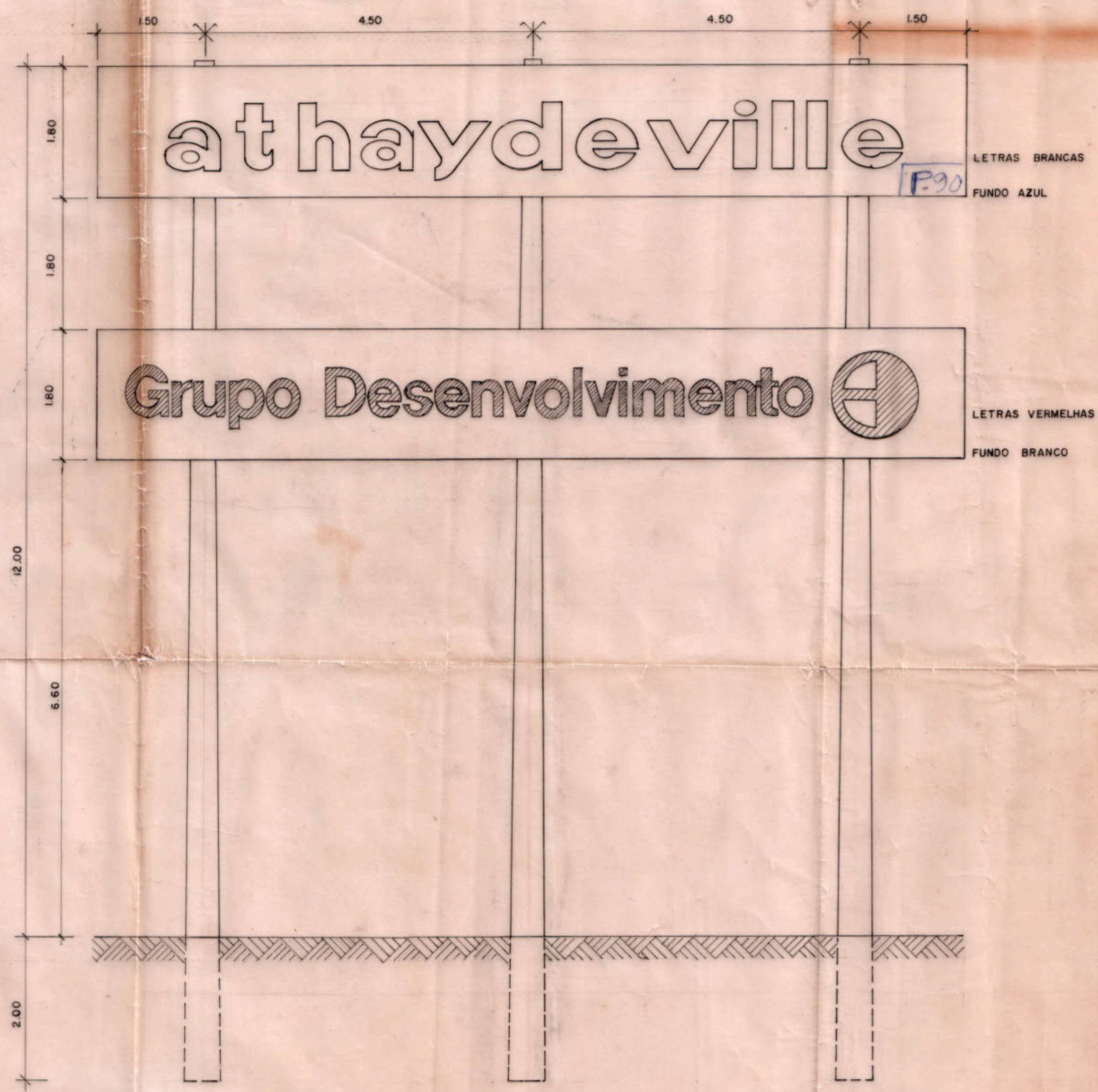
FACHADA - ESCALA 1:50

PLANTA PARA COLOCAÇÃO DE TRÊS CONJUNTOS DE LUMINOSOS COM DOIS LETREIROS CADA. TIPO CAIXA COM ARMAÇÃO DE FERRO REVESTIDOS DE ALUMINIO, FACES E LETRAS EM ACRÍLICO, ILUMINADOS INTERNAMENTE POR CONJUNTO DE FLUORECENTES, A SER COLOCADO NO LOTE 10 DO PAL. 32777. AVENIDA DAS AMÉRICAS KM 4. DIZERES DOS LETREIROS: ATHAYDEVILLE