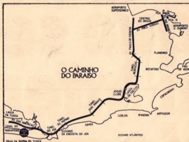
Um caminho que começa na Lagoa Rodrigo de Freitas, atravessa os túneis - "Dois Irmãos", "Pepino" e "Joá" - passa por um elevado sobre o mar e chega ao Paraíso. É a mais moderna auto-estrada da América Latina.

Agora a distância que separa o inferno do Paraíso são apenas 17 minutos.